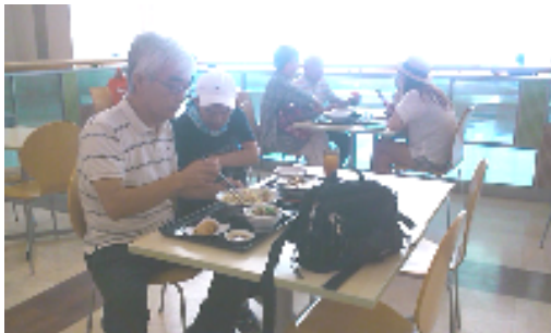
まずはフードコートでランチ♡