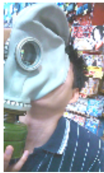
「どう？いい感じ？ガハハ！！」