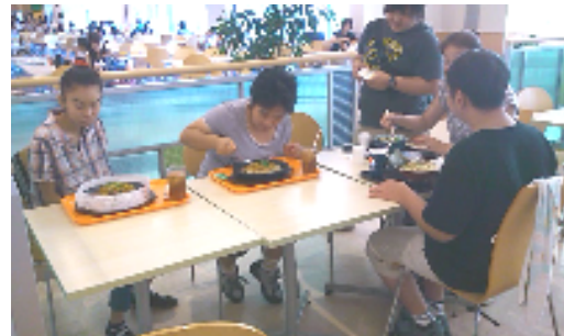
鉄板が熱い！でも、待てない！！